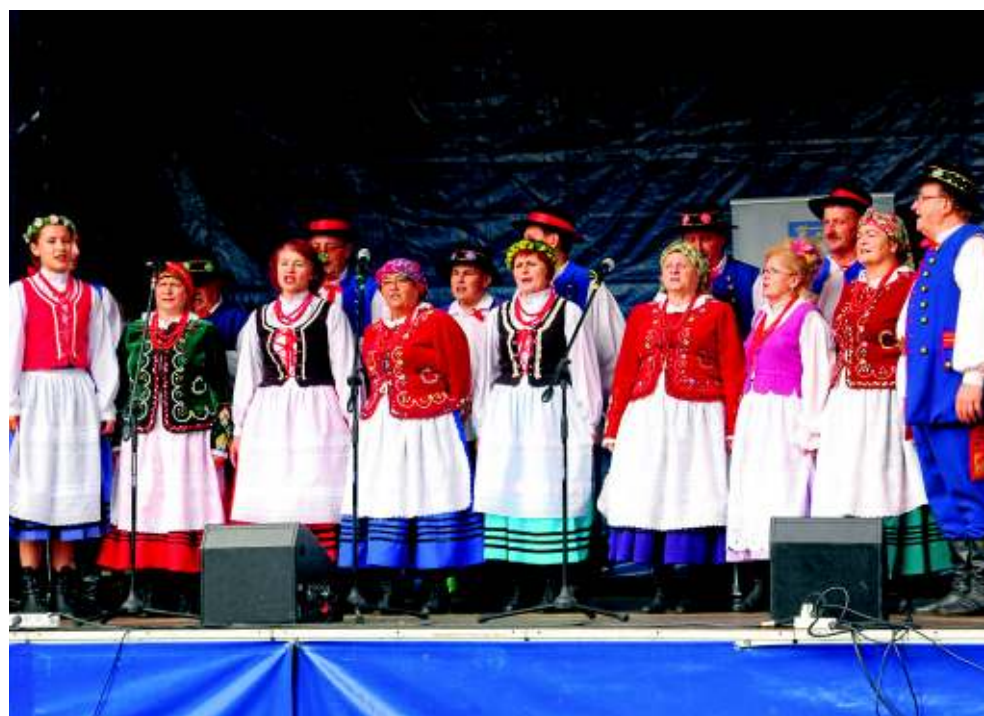
Niedziela w Szymbarku była rozśpiewana, bo w końcu odbywała się tam doroczna Panorama Kultur. Na scenie różnorodność muzyczna, ale nie mogło zabraknąć lokalnych akcentów. Zawsze w takich sytuacjach na wysokości zadania stanął zespół folklorystyczny Beskidy. (HGA)